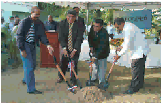
Primer palazo en Las Palmitas, San Cristóbal