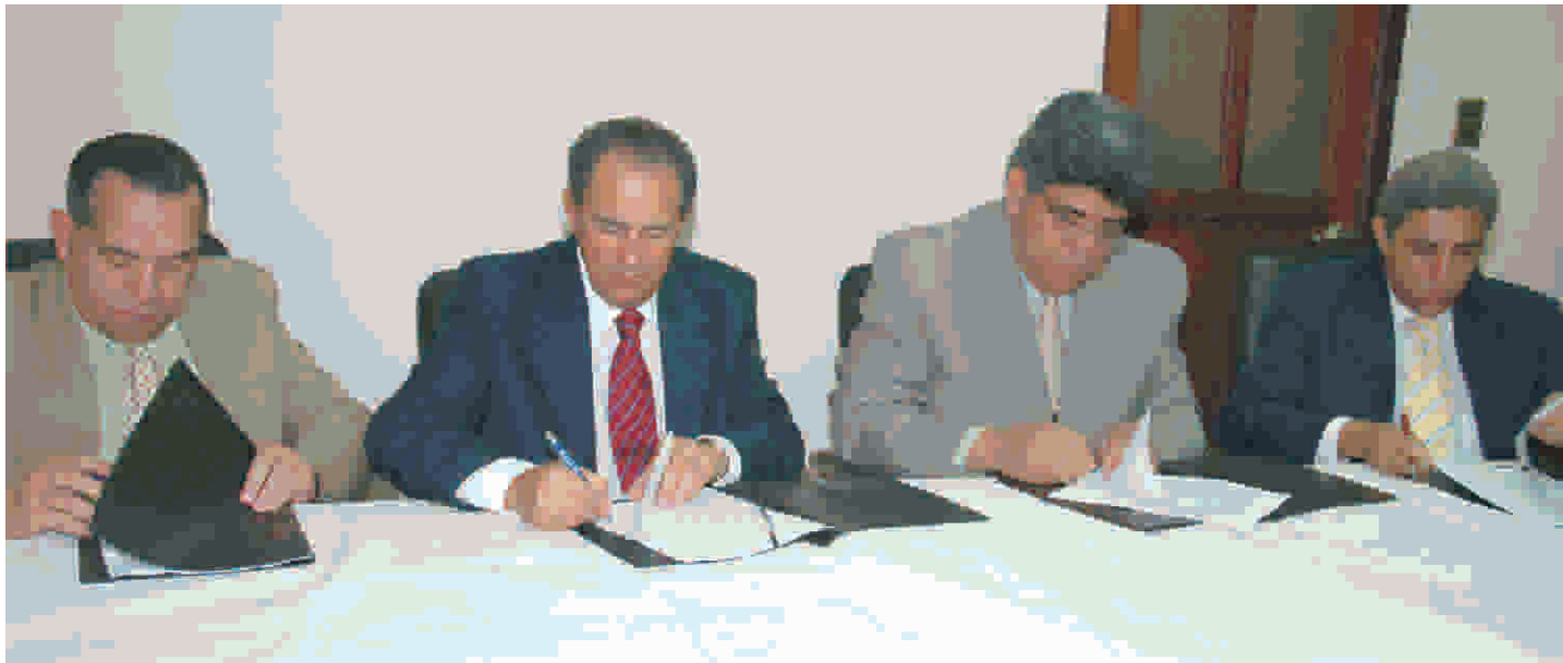
Firma de convenio entre FONPER, IAD, Bagrícola y Promefrin