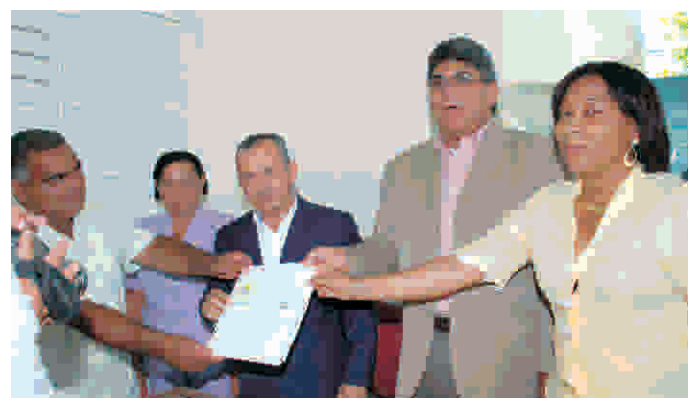
Entrega de cheque en hospital de Fantino

Conforme a lo acordado entre el FONPER y los ingenieros contratados, los trabajos deben ser realizados en un plazo no mayor de tres meses. De su lado, el subsecretario de Salud Pública para la región Nordeste, Doctor Freddy Hidalgo, informó que dará seguimiento personalmente a los trabajos de rehabilitación de los referidos hospitales, a fin de garantizar que los mismos se hagan correctamente.