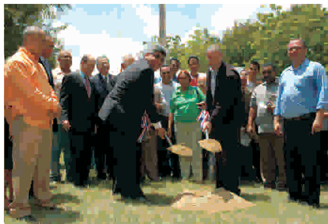
Primer palazo en IPISA, Santiago

De igual manera, el FONPER, a través de los departamentos correspondientes, daba los toques finales para iniciar la construcción de una estancia infantil en San Francisco de Macorís, provincia Duarte, así como para formalizar la entrega de un importante monto económico a la Casa de la Juventud para instalar una línea monofásica a los fines de ampliar la cobertura de Radio Juventud en el Cibao central.