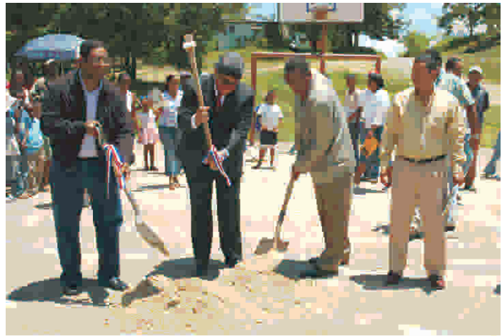
Primer Palazo en Batey Verde o Enriquillo

Así inició el presidente del FONPER sus palabras en el Batey Verde o Enriquillo, de Sabana Grande de Boyá, donde inició la construcción de una moderna cancha deportiva, con una inversión RD$1,200,459.78. De igual manera, dejó iniciado un programa de instalación de 70 soluciones sanitarias, con una inversión de RD$1,758,389.78.